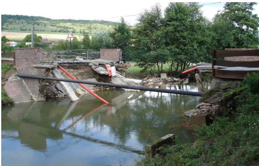
Crue de la Hem en Août 2006