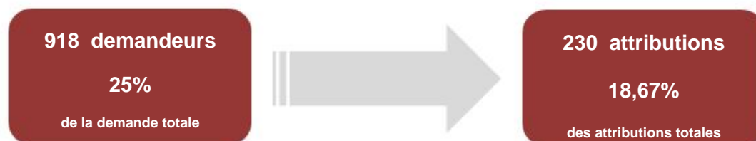
Répartition des attributions entre quartiles en fonction de la localisation