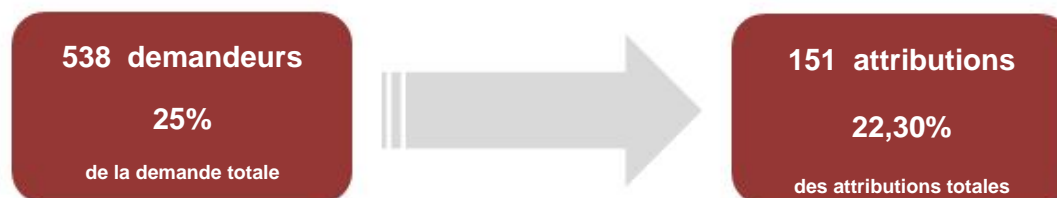
Répartition des attributions entre quartiles en fonction de la localisation