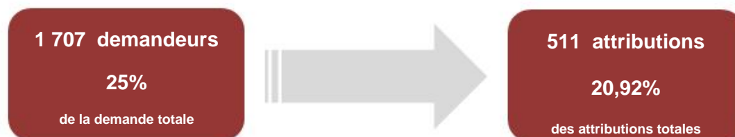
Répartition des attributions entre quartiles en fonction de la localisation