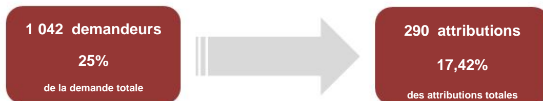
Répartition des attributions entre quartiles en fonction de la localisation