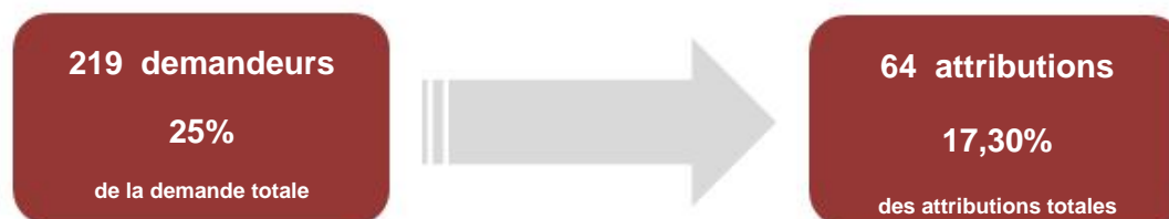
Répartition des attributions entre quartiles en fonction de la localisation