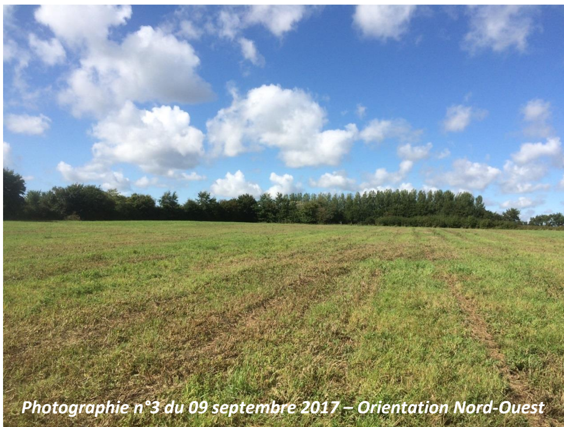
Photographie n°3 du 09 septembre 2017 – Orientation Nord-Ouest