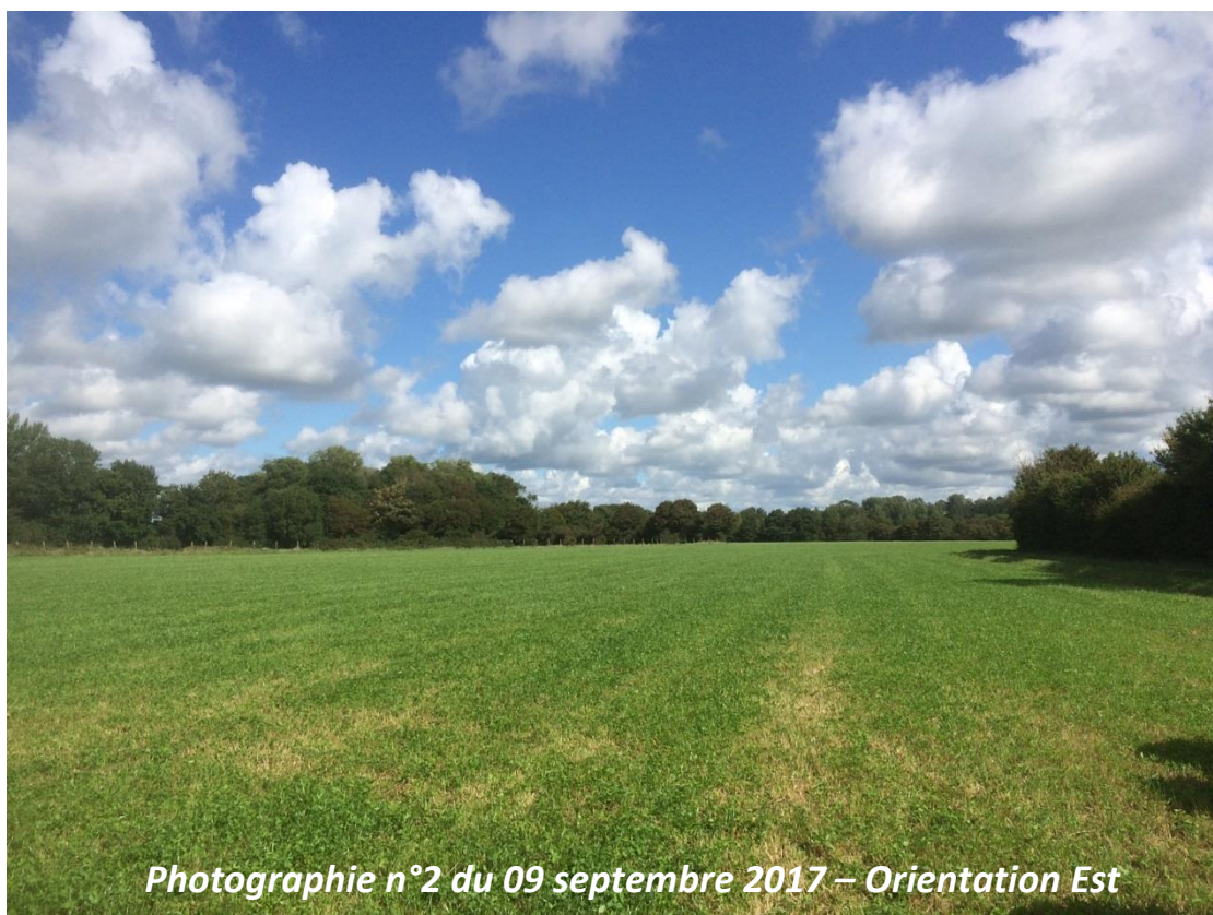
Photographie n°2 du 09 septembre 2017 – Orientation Est