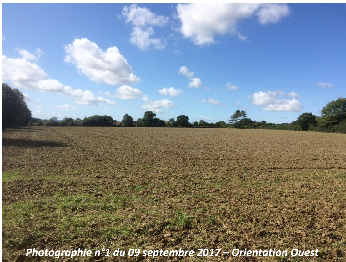
Photographie n°1 du 09 septembre 2017 – Orientation Ouest