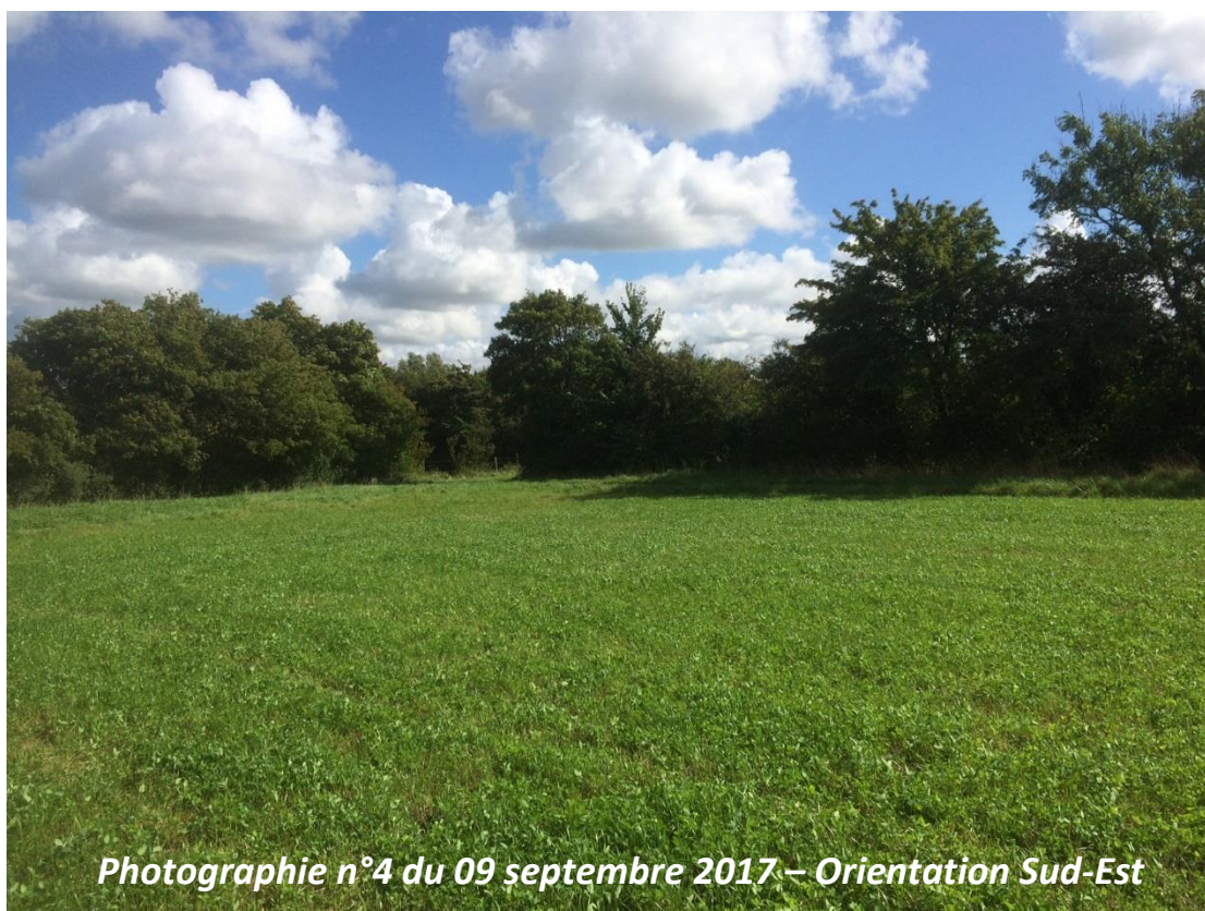
Photographie n°4 du 09 septembre 2017 – Orientation Sud-Est