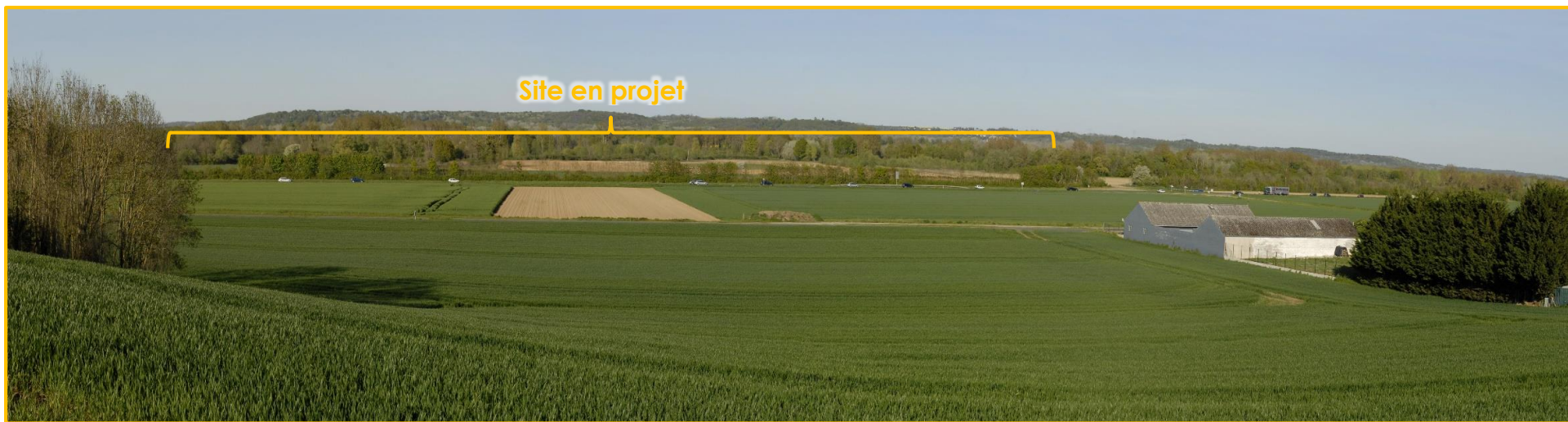
Vue extérieure du site depuis le chemin rural dit des Rozières à Vasseny en direction du Nord (vue n°6)