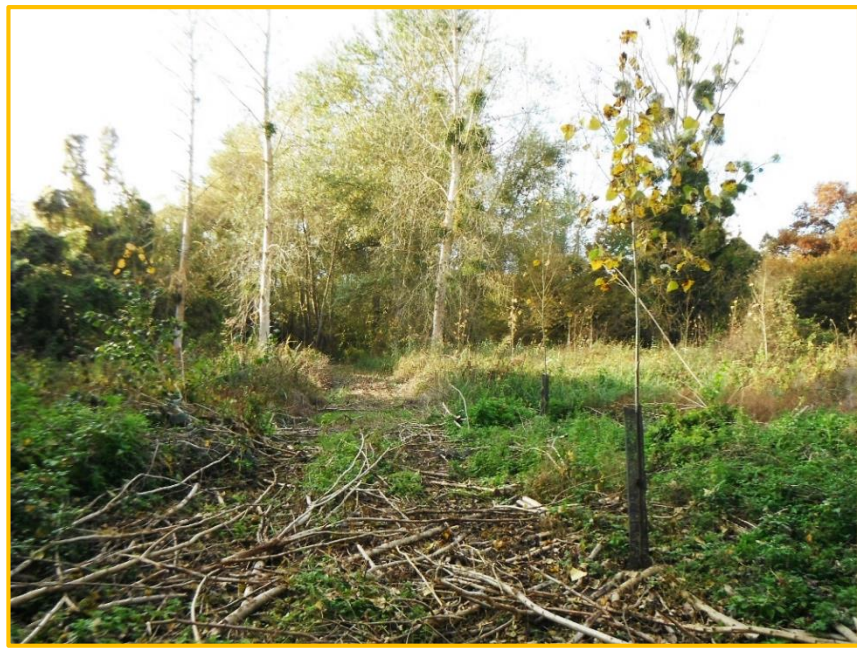
Vue intérieure du site depuis le chemin rural dit des Grands Marais en direction du Nord à gauche (vue n°5) et vers l'Ouest à droite (vue n°5)