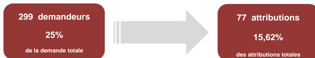
Répartition des attributions entre quartiles en fonction de la localisation