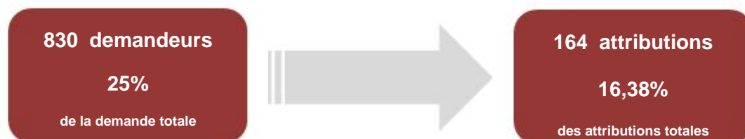
Répartition des attributions entre quartiles en fonction de la localisation