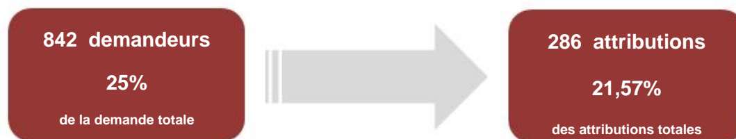
Répartition des attributions entre quartiles en fonction de la localisation