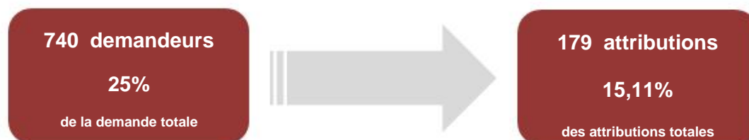
Répartition des attributions entre quartiles en fonction de la localisation