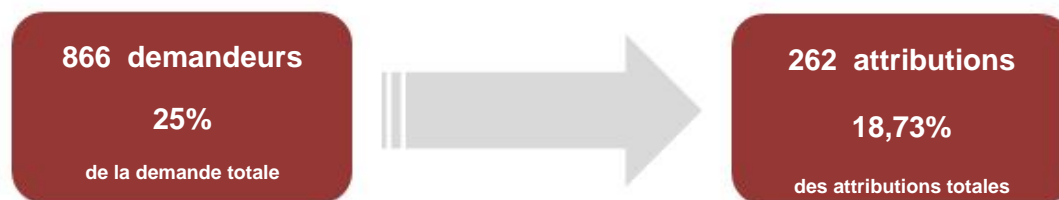
Répartition des attributions entre quartiles en fonction de la localisation