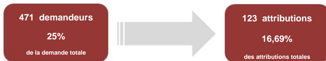
Répartition des attributions entre quartiles en fonction de la localisation