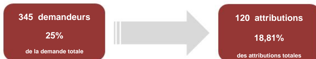
Répartition des attributions entre quartiles en fonction de la localisation