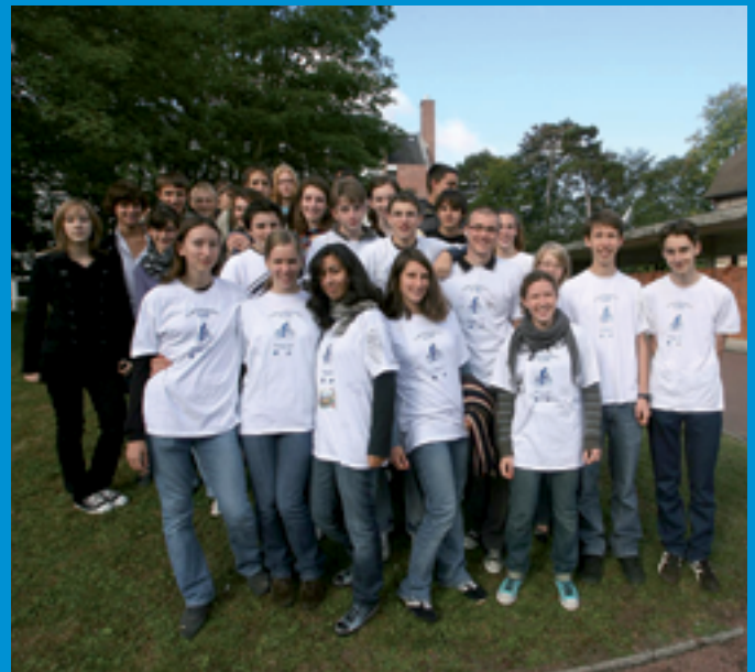
Écomobilité scolaire à Compiègne (60) Plan de déplacements des jeunes du lycée Pierre d'Ailly Journées "Venir au lycée sans voiture" des 18/09/07 et 03/04/08 Source et illustration : Jean-Luc GRANVALLET