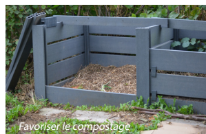
Favoriser le compostage