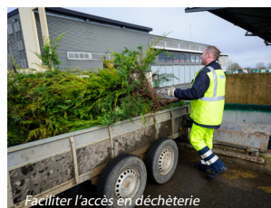
Faciliter l'accès en déchèterie

302 déchèteries réparties sur tout le territoire régional 98 % de la population de la région a accès à une déchèterie