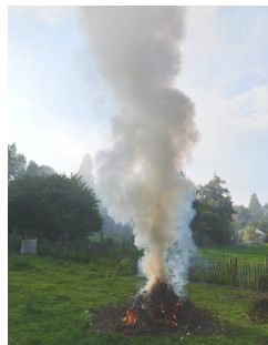
Brûlage effectué par des particuliers

Dans la région Hauts-de-France, la pollution de l'air par les particules fines (PM2.5) est à l'origine de 6 500 décès prématurés par an (source : Santé Publique France, 2016).