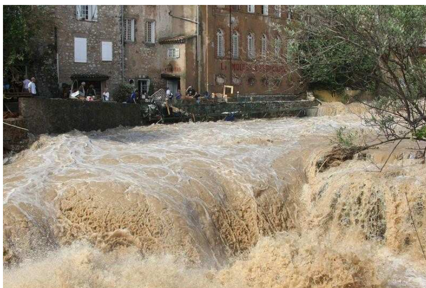
Trans-en-Provence (Var) – 15 juin 2010

Il est prioritaire de garantir et d'étendre la couverture des territoires en observations radar, qui déterminent la possibilité de proposer les services d'avertissement ci-dessus. Le réseau de radars hydrométéorologiques et son complément en mesures au sol devront donc être renforcés et renouvelés.