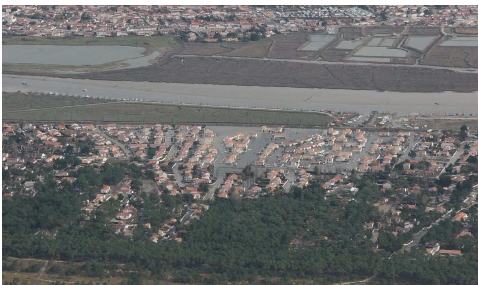
La Faute-sur-mer (85) après le passage de la tempête Xynthia - 28 février 2010

Une association étroite des parties prenantes (collectivités territoriales en particulier) sera mise en œuvre dans le cadre de la gouvernance.