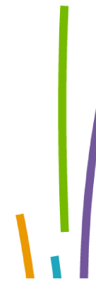
Répartition des acteurs représentés à la 1ère plénière