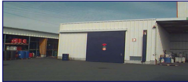
Produits solides inflammables