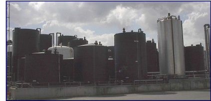
Chimie Minérale Produits en cuves