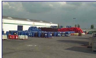
Chimie Minérale Produits conditionnés