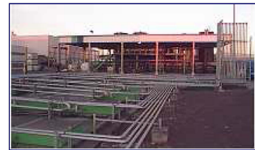
Solvants en cuves enterrées