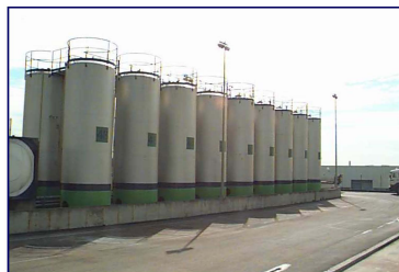
Solvants en cuves hors sol