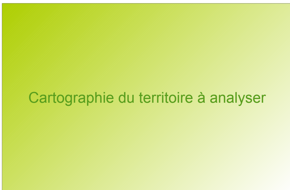
Carte des potentielles zones Calmes

La carte suivante localise les potentielles zones de calmes identifiées par le gestionnaire le long de son réseau. Elles ont été identifiées sur le réseau le plus circulé concerné par la cartographie du bruit.