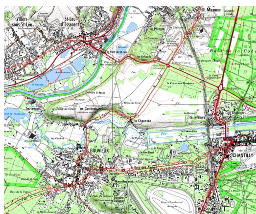
l'analyse macro : l'occupation des sols