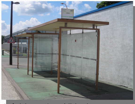
Arrêt de bus paraissant à l'abandon