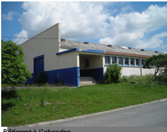
Bâtiment à l'abandon