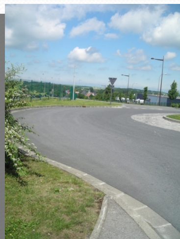
Pas de continuité piétonnière zone