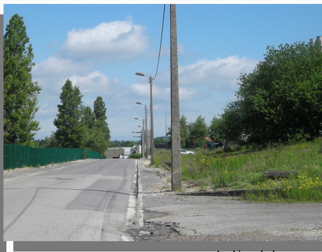
Arrière de la zone