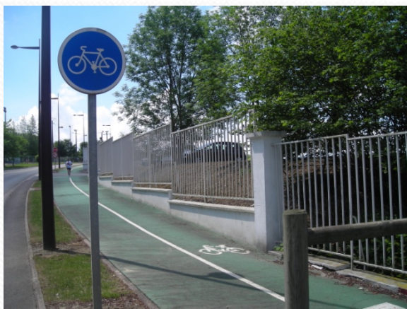
Trottoir et piste cyclable voie principale