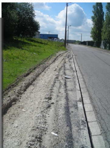
Trottoir défoncé arrière de la zone