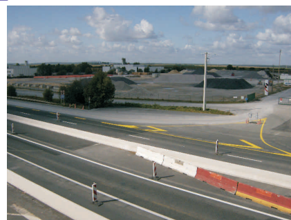
Aménagement provisoire pendant les travaux pour accéder au site Holcin.