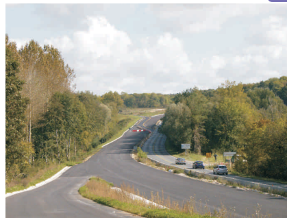
La chaussée neuve réalisée: vue depuis le pont de la RD 922.