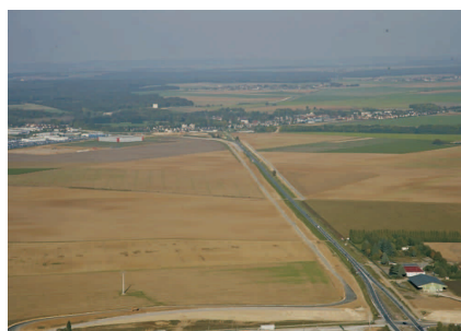
Terrassement des chemins agricoles parallèles à la RN 2 entre Plessis et Nanteuil