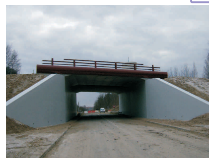
Ouvrage d'art de l'échangeur RD 136/RD148 : doublement du pont.