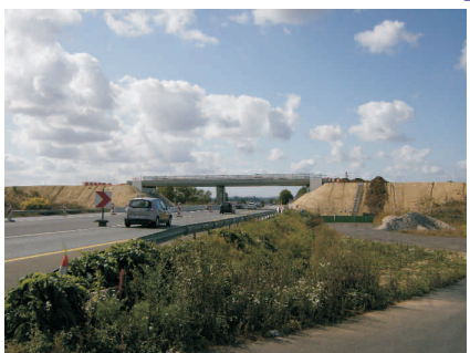
Le Plessis Nanteuil pont de la RD 548 : terminé.