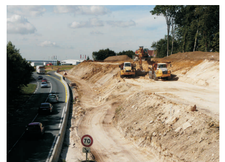
Doublement de la déviation de Nanteuil