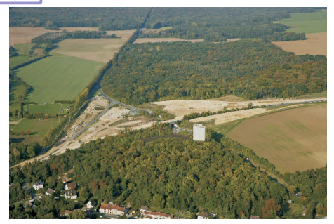
Requalification de l'échangeur de la RD 136 : les terrassements.