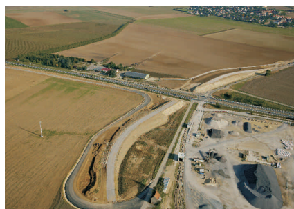
Le Plessis Nanteuil PS de la RD 548 en construction

La mise en service de la section Le Plessis-Nanteuil et de la déviation de Nanteuil devrait intervenir vers le 1er semestre 2013.