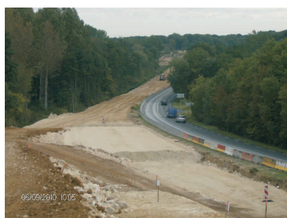
Construction de la chaussée neuve (sens Soissons/Paris)