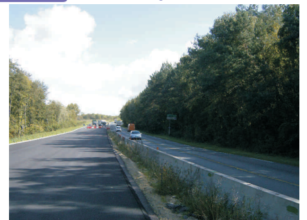
Différence d'altitude entre RN 2 actuelle et la chaussée neuve: protection assurée par glissières béton.