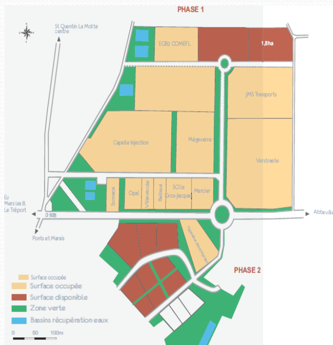
Plan de situation en 2010 http://investir-en-picardie-maritime.com