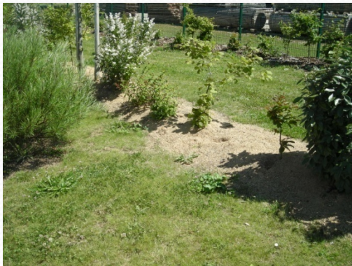
Sciure au pieds des plantes