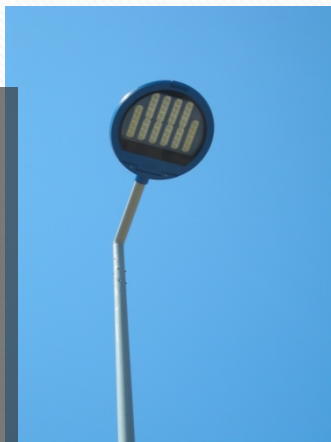
Lampadaire à LED