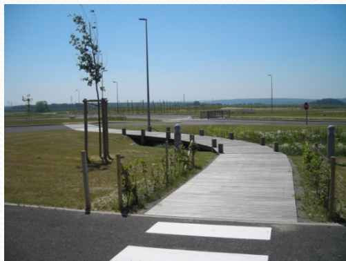
Passerelle suffisamment large pour les fauteuils roulants