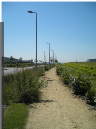
Sentes piétonnes et pistes cyclables