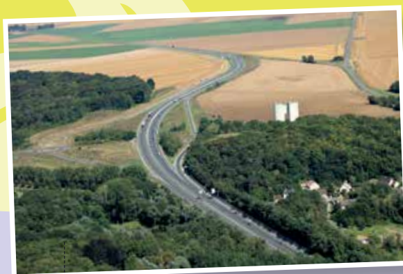
Fin provisoire de l'aménagement de la RN2 à 2x2 voies sur la déviation de Nanteuil-le-Haudouin.

Entre Laon et Avesnes-sur-Helpe, l'État s'est engagé à travers le PACTE pour la réussite de la Sambre-Avesnois-Thiérache à réaliser, à terme, la mise à 2x2 voies de la section et favoriser ainsi le désenclavement du territoire.