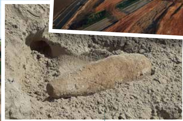
Juin 2022 - Evacuation d'un obus