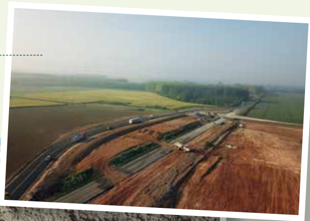
Mai 2022 Terrassement et shunt actif