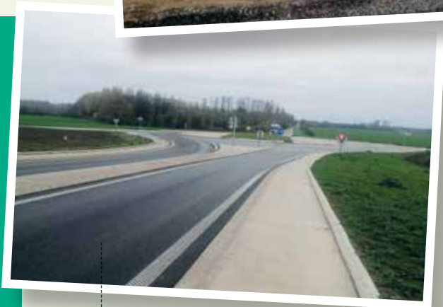
Octobre 2022 - Chaussée et giratoire réalisés

La réalisation de terrassements et ouvrages hydrauliques préparatoires a permis le démarrage des travaux du pont-rail en septembre. Une prochaine lettre présentera en détail ce projet.