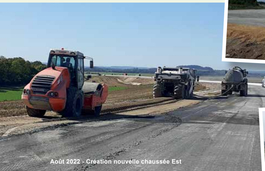
Août 2022 - Création nouvelle chaussée Est