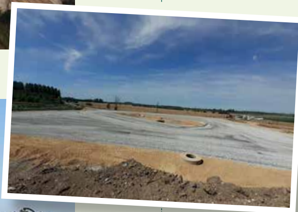
Juin 2022 - Construction du giratoire