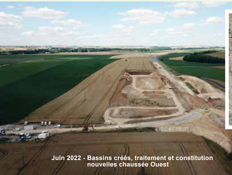
Juin 2022 - Bassins créés, traitement et constitution nouvelles chaussée Ouest