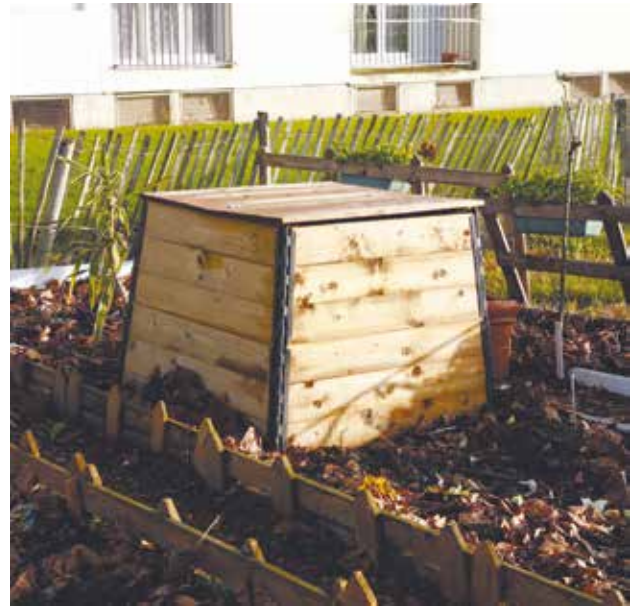
La pratique du compostage partagé se développe de plus en plus.

Dans votre immeuble, votre résidence ou votre quartier; parlez-en autour de vous pour savoir si des habitants voudraient participer; mobilisez vos voisins, c'est un des gages de réussite d'une telle opération.