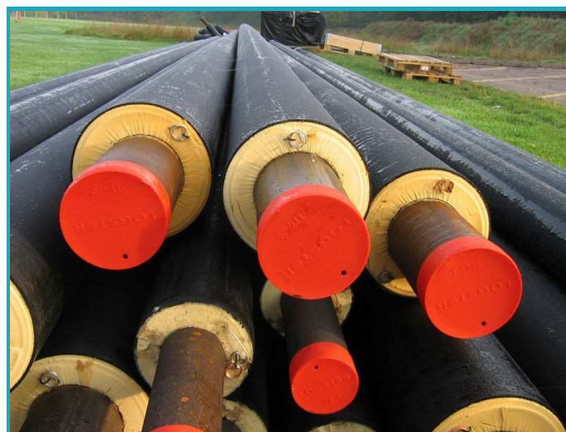
Canalisations en attente de pose

La pose peut se faire en caniveau enterré , ce qui permet une protection mécanique et minimise les effets dus à l'humidité par ventilation de ces caniveaux. Elle peut également se faire en tranchée , solution moins coûteuse, mais nécessitant que les gaines soient entourées d'un film protecteur contre l'humidité et quelles soient installées à une profondeur suffisante afin d'absorber les efforts de la surface.