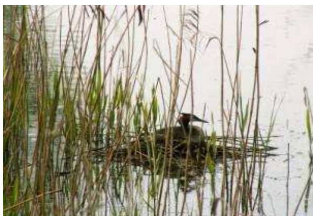
Étang du Romelaère