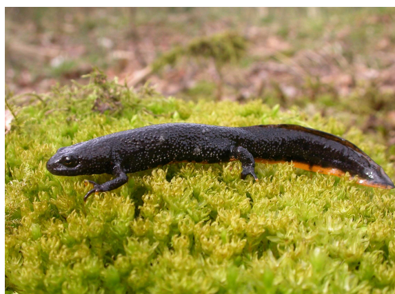
Triton crêté