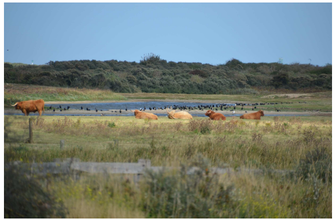
Pâturage par les vaches des Highlands