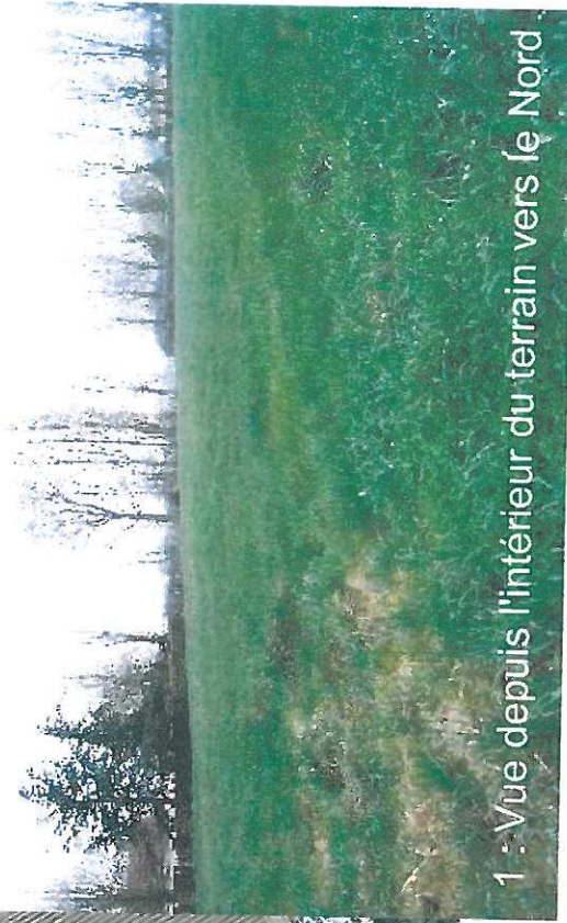
1 : Vue depuis l'intérieur du terrain vers le Nord