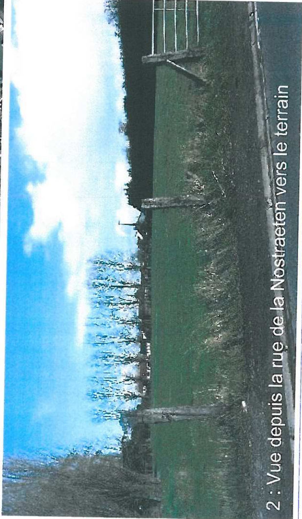
2 : Vue depuis la rue de la Nostraeten vers le terrain