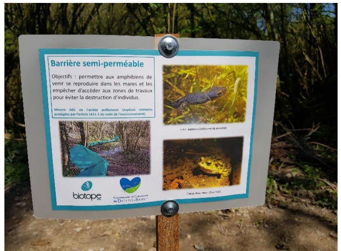
Barrière à amphibiens remise en état et panneaux de sensibilisation mis en place