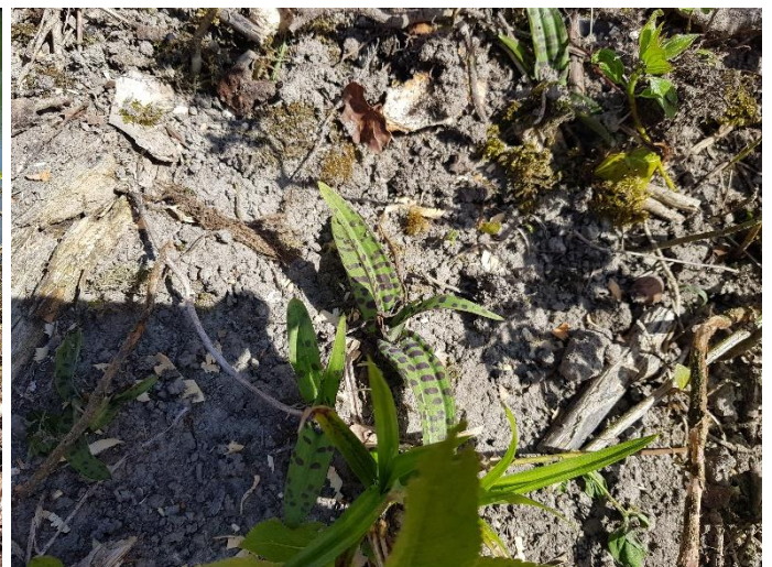
Nouvelle station composée de 18 pieds d'Orchis de Fuchs