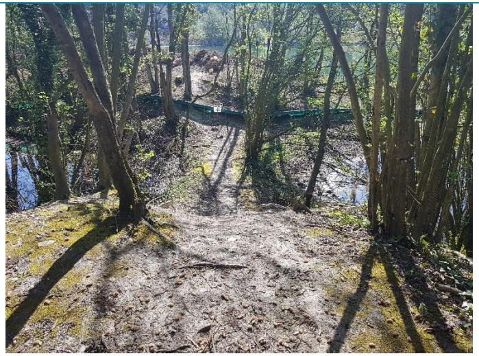
Jonction barrière/platelage à optimiser et chemin de VTT non condamné