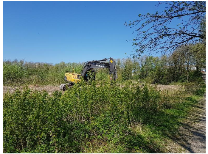
Débroussaillage effectué et en cours.