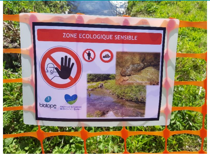
Balisage des zones à enjeux remis en état et panneaux de sensibilisation

Non conforme : Le balisage des stations d'Orchis de Fuchs, n'a pas été réalisé avant l'intervention de l'entreprise. Des terrassements, stationnements et cheminements, ont été effectués sur des zones où les orchidées étaient présentes historiquement. Une destruction de pied est donc potentielle. L'entreprise BARA, en charge du dessouchage/débroussaillage, a confirmé que le cahier des prescriptions écologiques ne lui avait pas été transmis, avant toute intervention sur le chantier, il est impératif que celui-ci soit fourni aux sous-traitants.