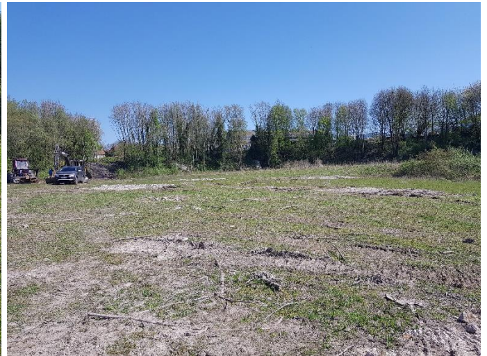
Terrassements (sondages), cheminements en l'absence de balisage des pieds d'Orchis de Fuchs.

Une station d'Orchis de Fuchs a été découverte dans un secteur (plateau sportif/zone humide à créer) où l'espèce n'avait pas été recensée lors de l'étude d'impact. Le développement de cette station de 18 pieds est très certainement lié à la mise en lumière du site, provoquée par la coupe des arbres à l'automne 2017. Cette station a immédiatement été balisée, en attendant que les pieds soient dans la zone d'accueil.