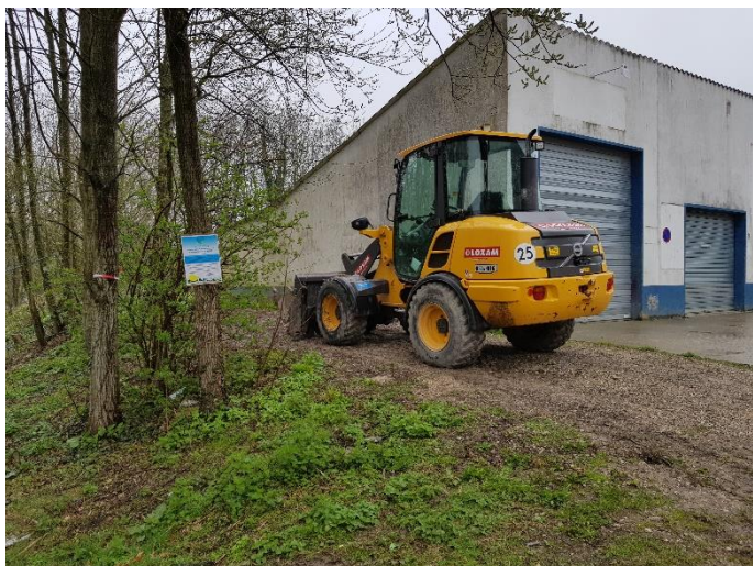
Zone de stockage conforme

Conforme : toutes les zones de stockages sont situées en dehors des milieux naturels présents au droit du platelage en cours d'installation.