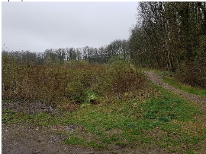
Présence de milieux favorables pour la nidification des oiseaux sur des zones à terrasser.