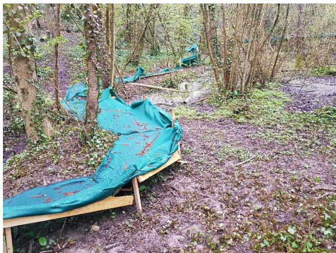
Barrière à amphibiens dégradée depuis le 07/02/2018 non remise en état.

L'entreprise indique que la barrière sera remise en état et finalisée en semaine 16, lors de la préparation de chantier.