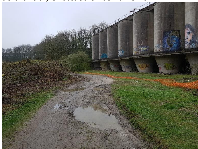
Balisage des zones à enjeux dégradé

Il est donc nécessaire de remettre en place le balisage, l'entreprise indique que le balisage sera remis en place lors de la préparation de chantier, effectuée en semaine 16.