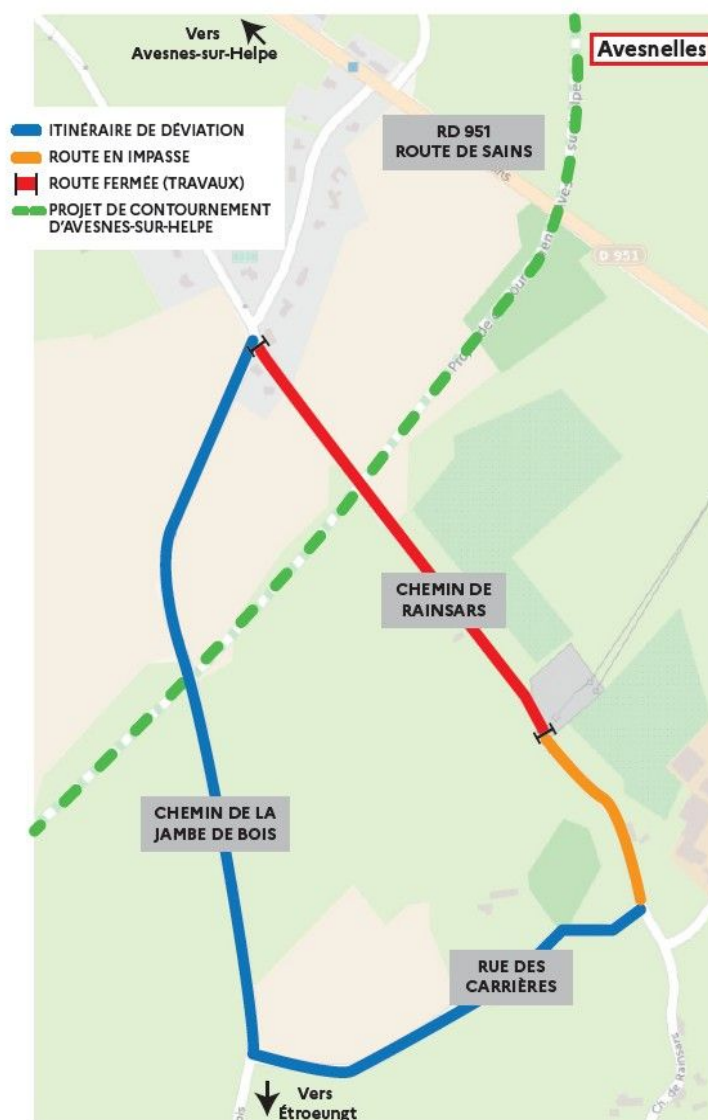
Figure 1: Plan de déviation chemin de Rainsars – Fin des travaux prévue en octobre 2025

Une déviation passant par le chemin de la Jambe de Bois est en place jusqu'à la fin des travaux :