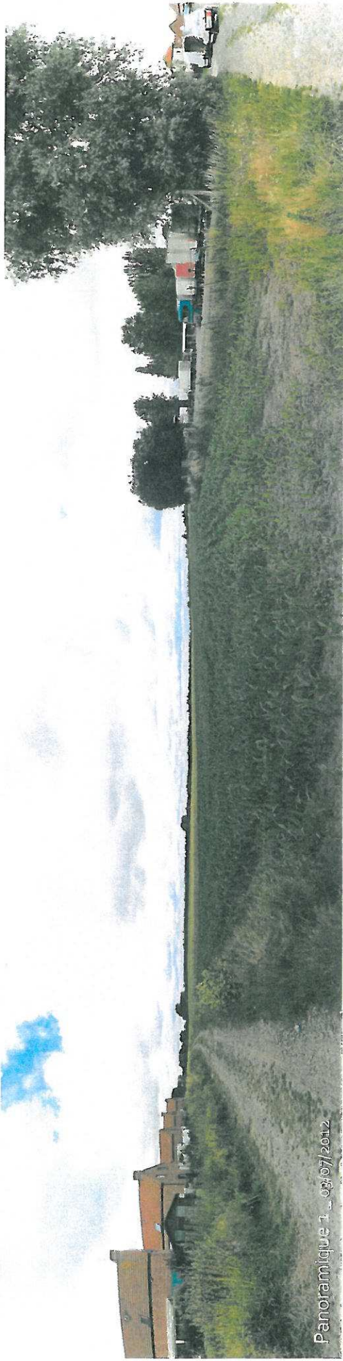
Panoramique 1 _ 03/07/2012