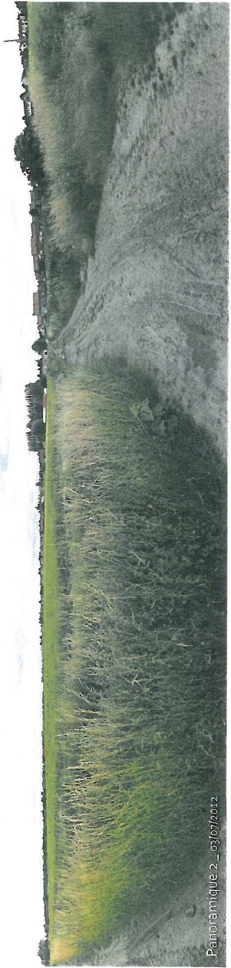
Panoramique 2 _ 03/07/2012