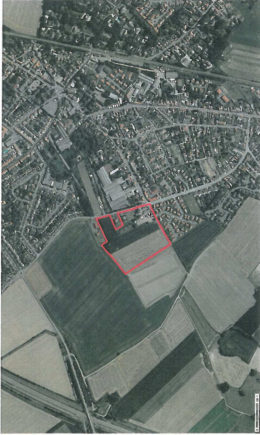
photo aérienne 2012 _ 1/5000