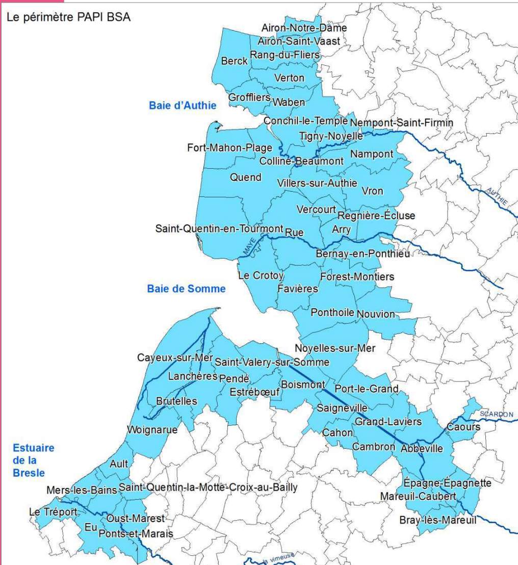
Le périmètre PAPI BSA