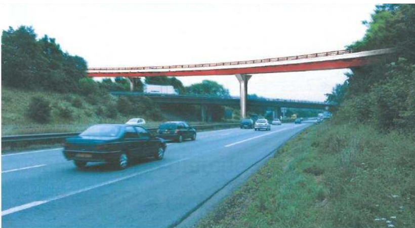
Le futur viaduc (photomontage)

Le plan d'ordonnement des travaux de la bretelle Paris vers Lille. Les travaux de construction du viaduc sont matérialisés en couleur violette.