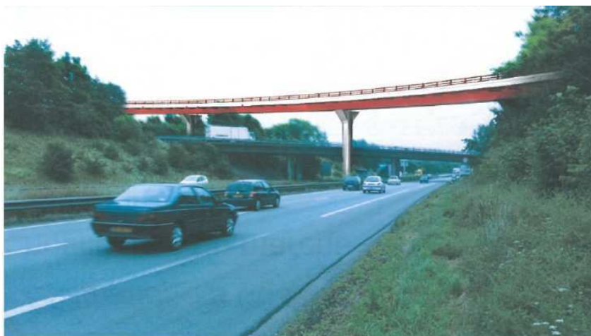
Le futur viaduc (photomontage)

En jaune, les travaux de la première phase achevés en 2009 En orange, les travaux de la seconde phase qui démarrent le 25 mars 2013