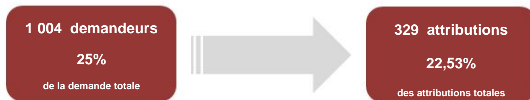
Répartition des attributions entre quartiles en fonction de la localisation