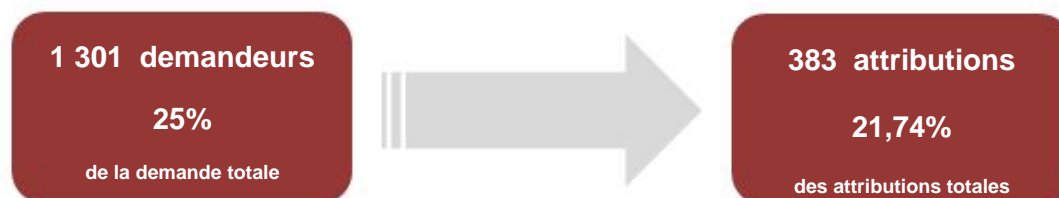
Répartition des attributions entre quartiles en fonction de la localisation