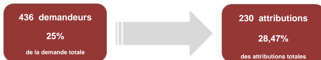
Répartition des attributions entre quartiles en fonction de la localisation