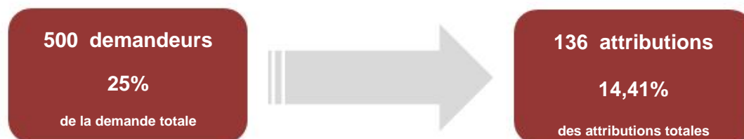
Répartition des attributions entre quartiles en fonction de la localisation