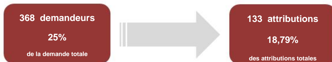
Répartition des attributions entre quartiles en fonction de la localisation