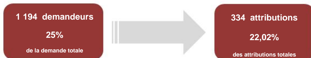
Répartition des attributions entre quartiles en fonction de la localisation