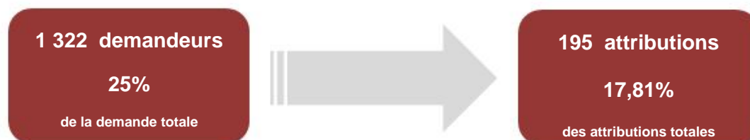
Répartition des attributions entre quartiles en fonction de la localisation