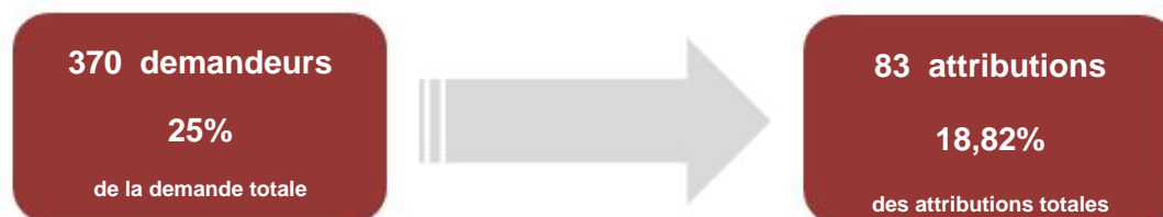
Répartition des attributions entre quartiles en fonction de la localisation