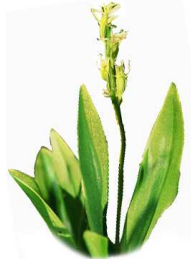
Liparis de Loesel

Parmi les 234 espèces végétales supérieures recensées dans le marais, 34 sont exceptionnelles ou rares en Picardie et 8 sont protégées par la loi.