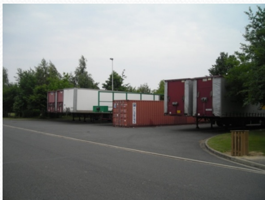
Zone d'attente poids lourds