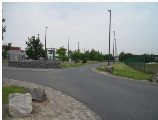
Absence de trottoirs