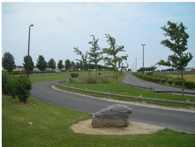
Espace planté à côté de l'aire poids lourds