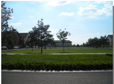
Forte imprégnation végétale