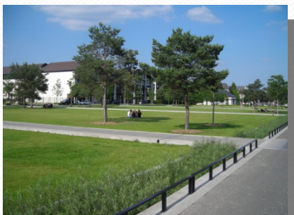
Sentes piétonnes traversant le parc