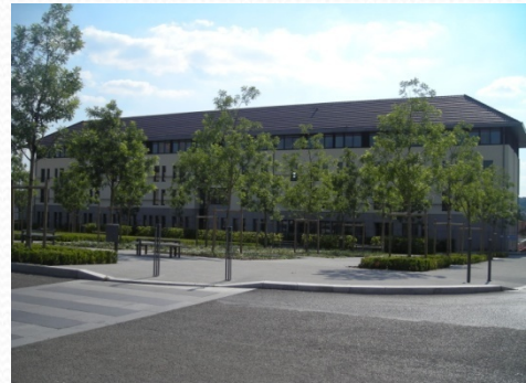
Parc, espace de détente