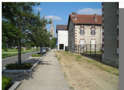
Présence de larges trottoirs