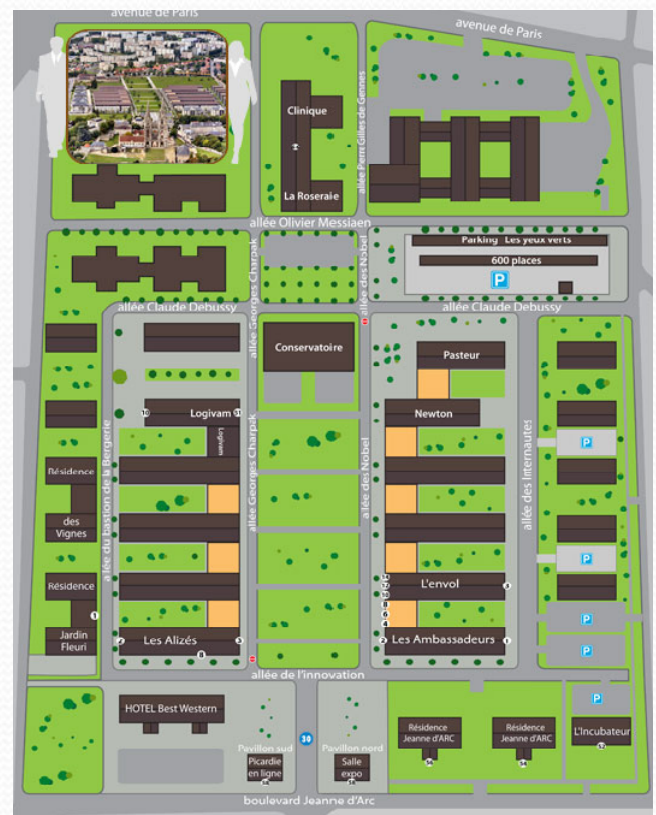
Plan de situation en 2010 www.parc-gouraud.fr

Juillet 2010 - Conception et rédaction Julie Richard lors de son stage à la DREAL Picardie / service ECLAT