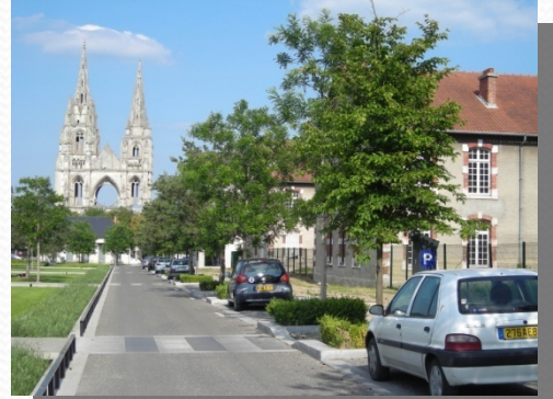
Places de parkings le long de la voirie