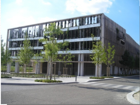
Parking aérien végétalisé