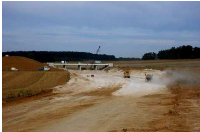
Terrassements de la section courante

Les travaux de terrassements et de chaussées de la section courante réalisés par le groupement CHARIER TP/BRETHOME se sont achevés en novembre 2011, après 14 mois de délais. Le volume de terrassement s'élève à 600 000m 3 .