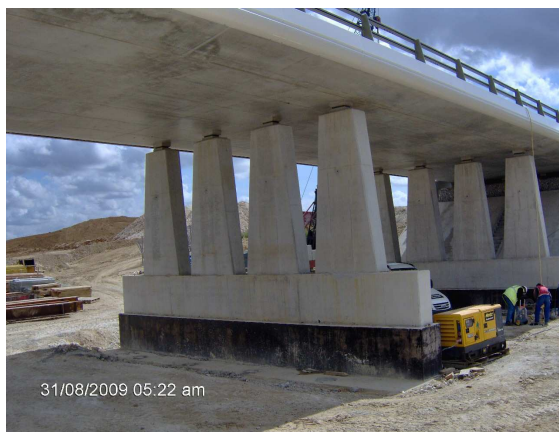
Ouvrage d'art N°4

Les ouvrages d'art N°1, 4 et 5 en passages supérieurs de type dalle en béton armé de 4 travées ont été réalisés en 2009 par BAUDIN/CHATEAUNEUF, ils assurent le rétablissement des routes départementales RD 37/931 à Breuil-le-Sec, RD 137 et 161 à Catenoy. Les travaux de rétablissement et de chaussées ont été assurés par l'entreprise RAMERY TP.