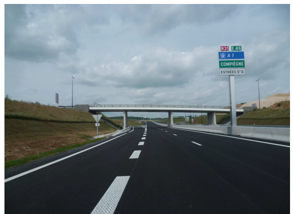
Ouvrage d'art N°1