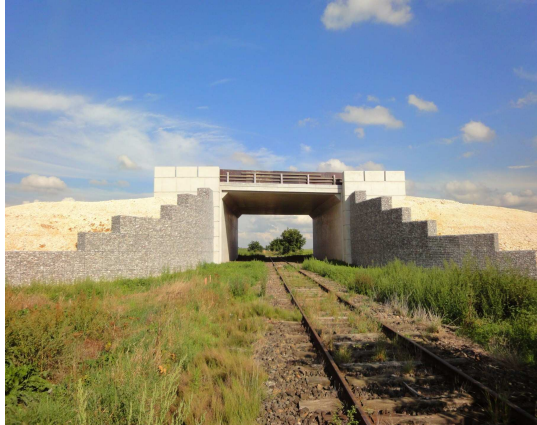
Ouvrage d'art N°7

Le dernier ouvrage d'art le N°7 de type portique ouvert a été construit durant le 1er semestre 2010 par l'entreprise DEMATHIEU & BARD. Il permet de franchir une voie ferrée à Catenoy.