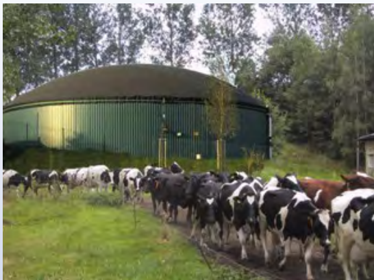
Méthanisation Une filière qui commence à émerger en France