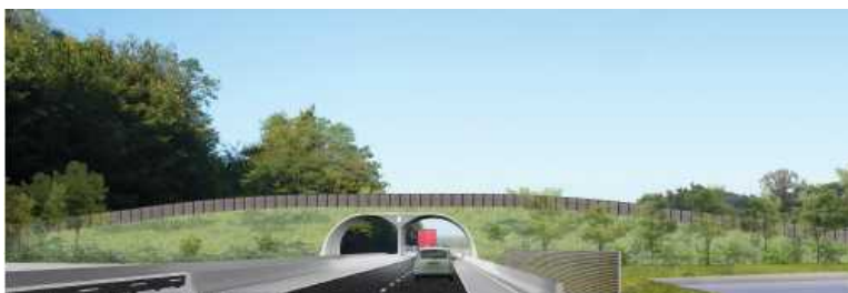
Projet de passage faune – esquisse AEI

La démarche environnementale menée par la DREAL Picardie pendant les études a conduit le maître d'ouvrage à rétablir le corridor de déplacement de la grande faune bois de Tillet/talweg de Vaumoise par un passage grande faune spécifique en passage supérieur de 25 mètres de largeur.