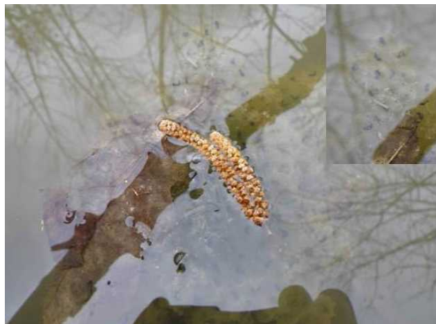
Pontes de grenouilles rouges