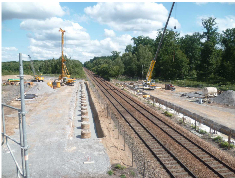
Réalisation des fondations : Pieux de diamètre 1200mm de 7m de profondeur

L'une des principales contraintes est d'assurer la sécurité du chantier vis à vis de la circulation ferroviaire. ; certaines phases de travaux doivent être réalisées sous interruption de circulation ferroviaire, de nuit ou de week end notamment pour le coulage du tablier qui aura lieu lors week-end de pâques 2014.