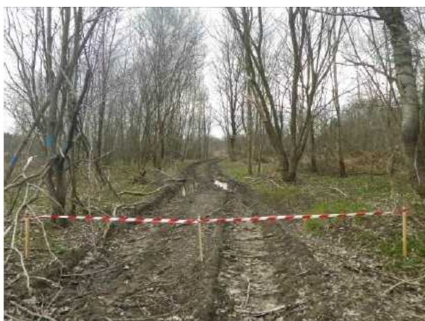
Balisage de zones sensibles pendant les travaux

Un coordonnateur environnemental réalise aujourd'hui le suivi environnemental de la réalisation des études et des travaux. Son rôle est de veiller au respect des mesures environnementales et de sensibiliser les différents acteurs du chantier. Cela s'est par exemple traduit par la pose d'un balisage autour d'ornières qui s'étaient formées dans un chemin forestier et dans lesquelles se trouvaient des pontes des grenouilles rouges.