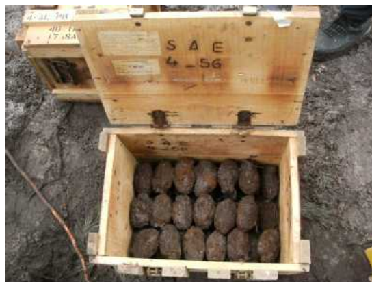
Environ 200 grenades ont nécessité l'intervention des démineurs