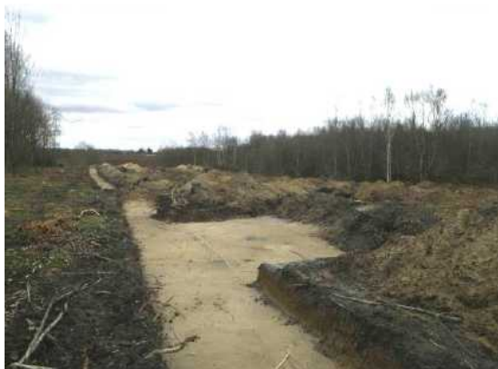
Déboisement et diagnostic archéologique

Le diagnostic archéologique de la trace de la RN2 en forêt a été réalisé au printemps 2013. Il se poursuivra en plaine après les récoltes fin 2013. Le diagnostic consiste en la réalisation de tranchées de faible profondeur, sur environ 10 % de la surface, afin de révéler la présence éventuelle de vestiges archéologiques. Les archéologues du service archéologique du Conseil Général de l'Aisne ont notamment mis au jour une caisse de munitions anglaises datant de la 1 ère Guerre Mondiale.