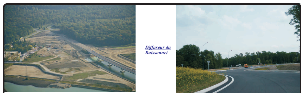
Diffuseur du Buissonnet

La déviation a été mise en service le 30 septembre 2011. Les travaux d'aménagements paysagers sont en cours de réalisation. La signalisation directionnelle définitive doit être mise en conformité. Le déclassement de l'ex RN 31 (en traversée de Compiègne) reste à réaliser.