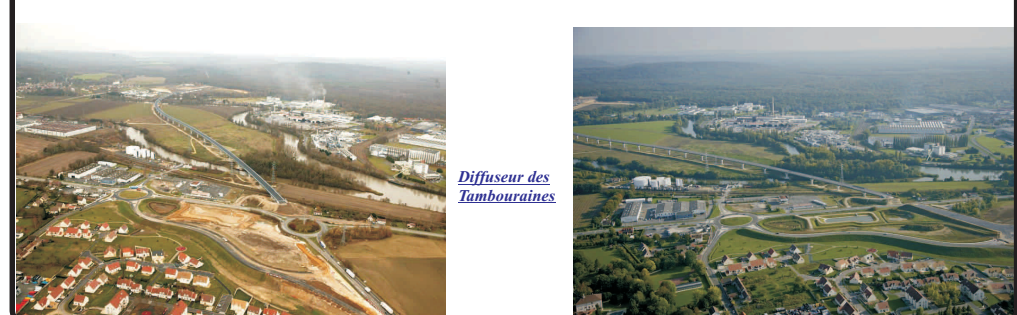
Diffuseur des Tambouraines