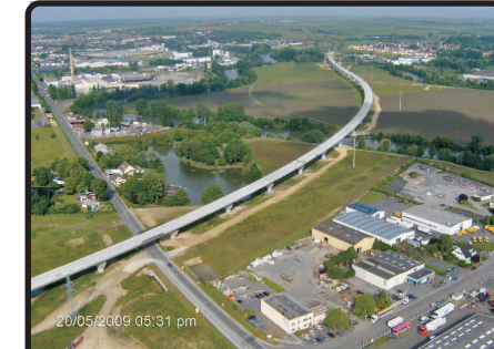
Viaduc de Oise - Aisne