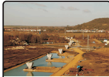
Viaduc de Oise - Aisne