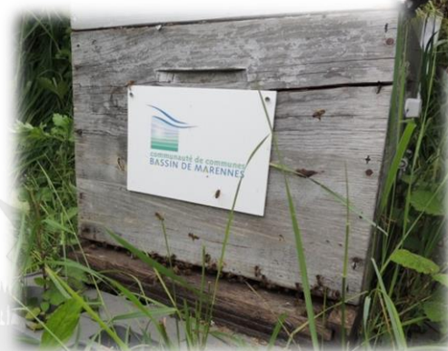
Bio surveillance de l'environnement, Apilab