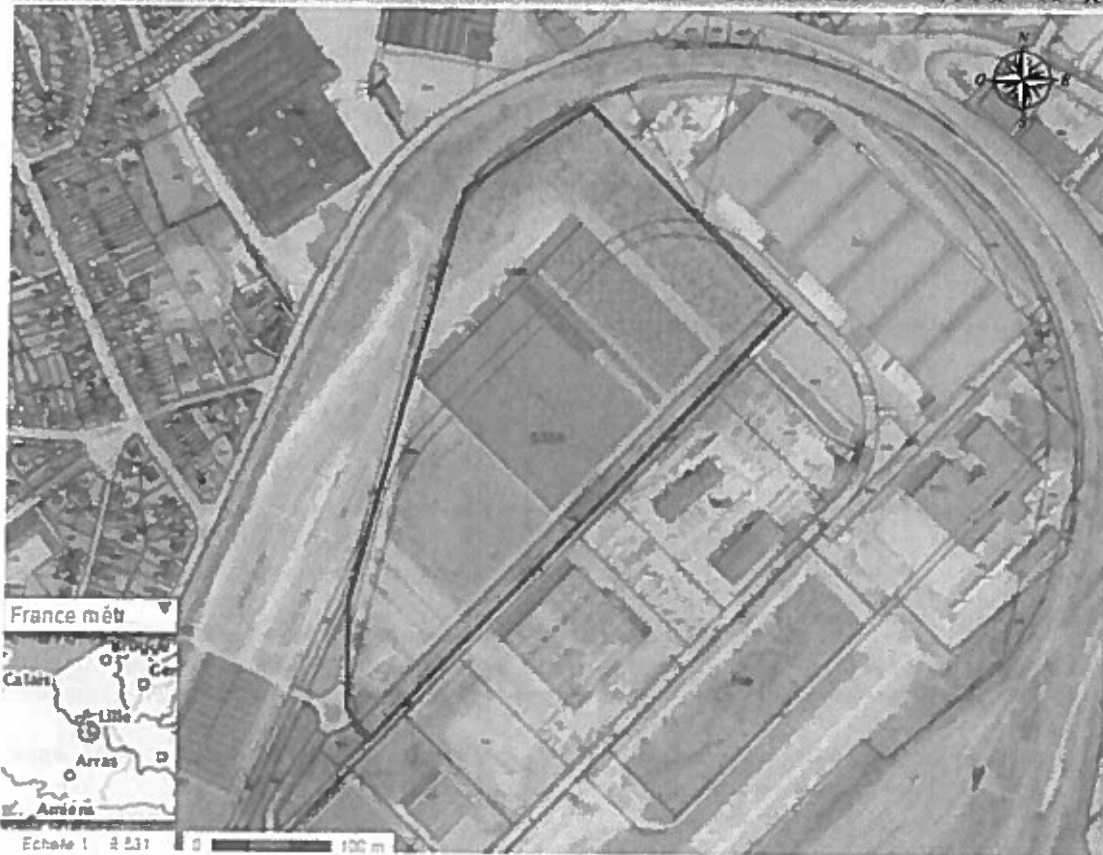
Situation géographique du projet